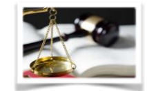
Formation et sensibilisation