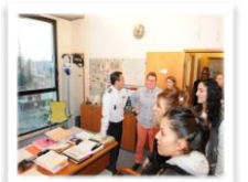
Rencontres et échanges