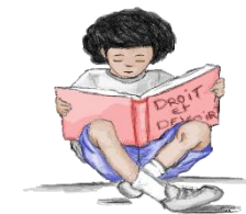
Les droits et les devoirs