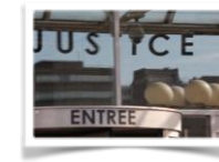
La justice en France