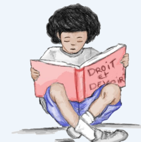
Les droits et devoirs