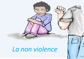
La non violence